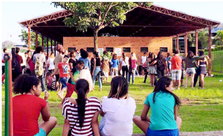
Sarau em defesa de um Plano Diretor Popular

“O Plano Diretor não deve ser visto como um plano de governo, que representa a visão