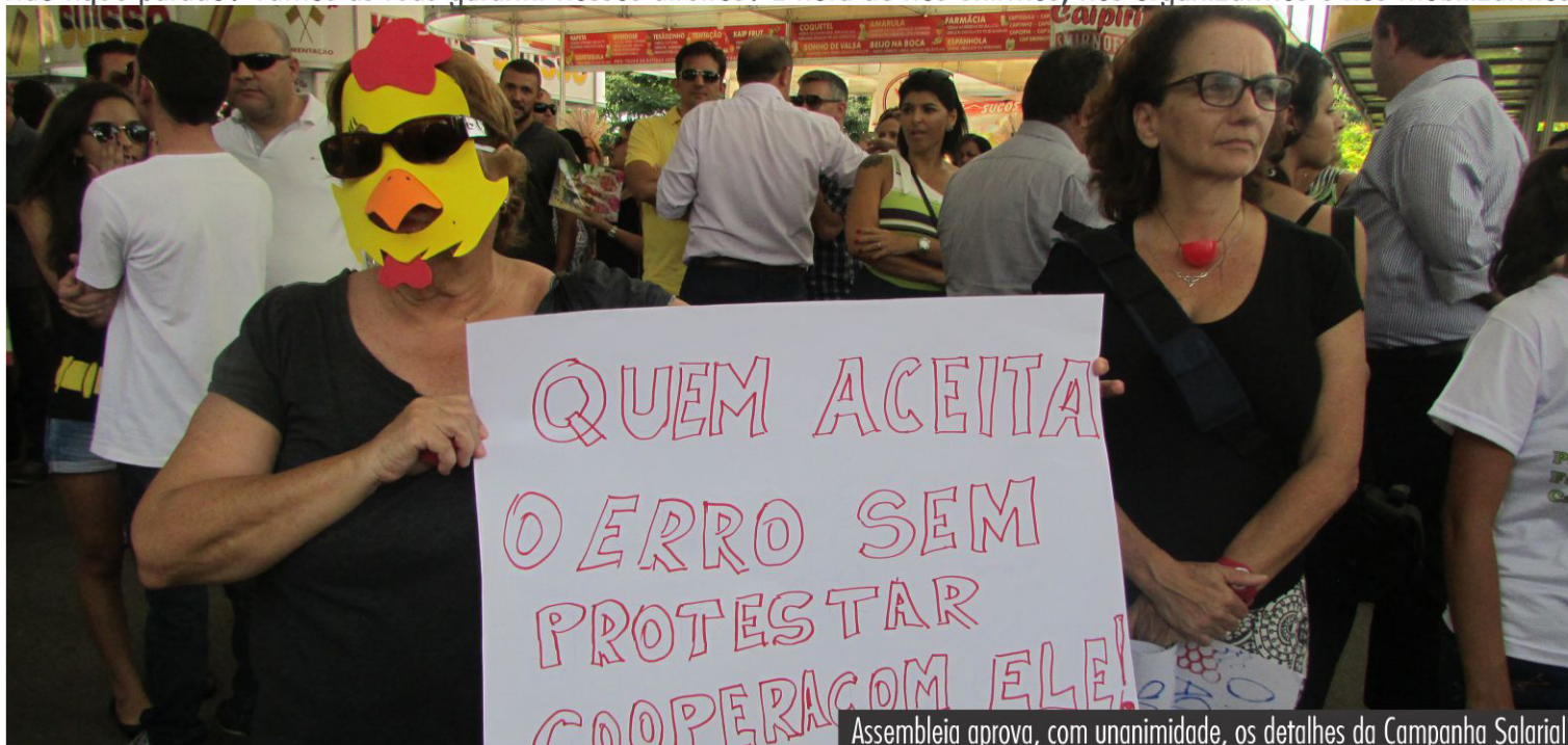
Assembleia aprova, com unanimidade, os detalhes da Campanha Salarial

Não fique parado! Vamos às ruas garantir nossos direitos! É hora de nos unirmos, nos organizarmos e nos mobilizarmos!